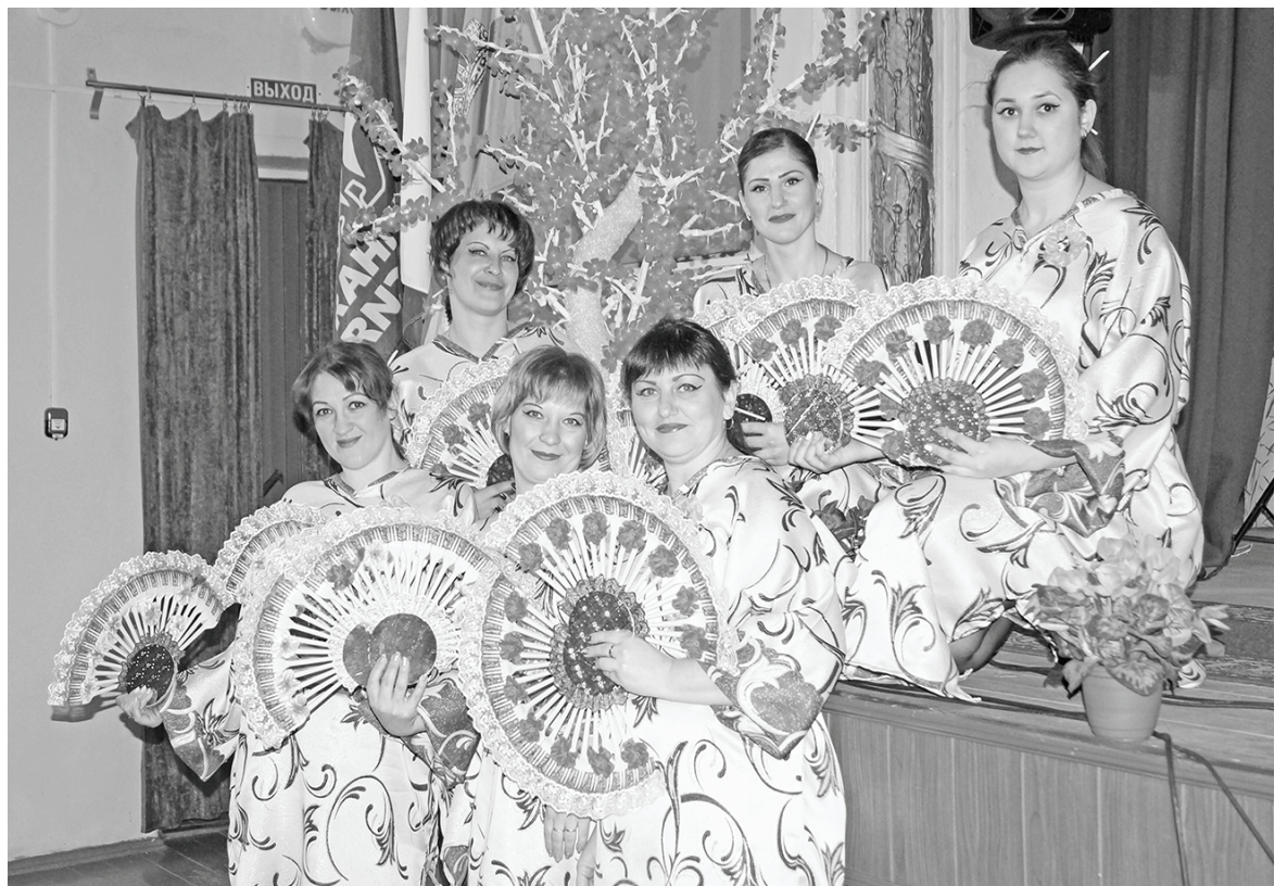
Ансамбль «Туруми», Думиничская средняя школа №3.

Молодцами показали себя и «Веселые девочки» (Думиничская школа №1). Для пес-