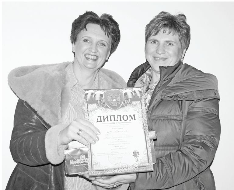
Брянский дуэт «Нежность».

В пятницу состоялся традиционный районный конкурс художественного творчества педагогов «Шире круг». На этот раз он прошел в РДК: организаторам (отдел образования) хотелось собрать больше зрителей. И это удалось – пустых мест в зале практически не было.