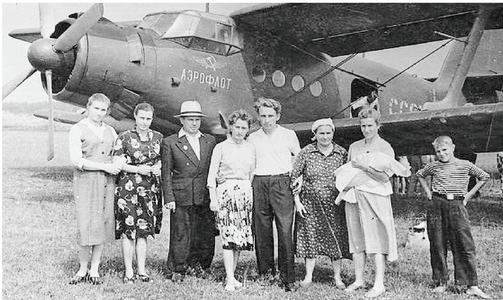
Аэродром. Думиничи, 1961 год.